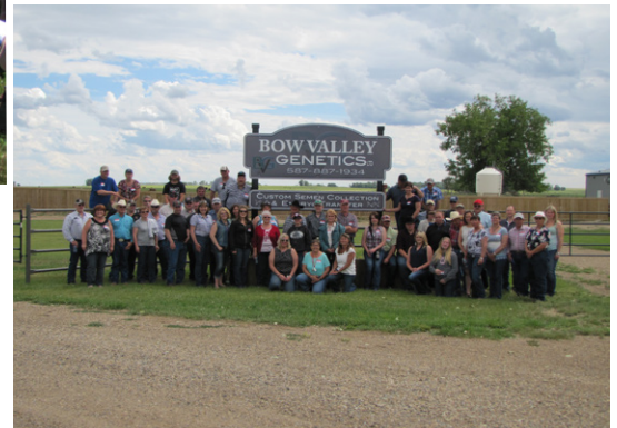
Le groupe de participants à la journée lors de la visite de Bow Valley Genetics.