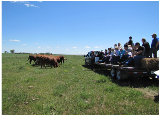
Visite des taureaux en croissance au pâturage chez de Jager Limousin à Rolling Hills, AB.